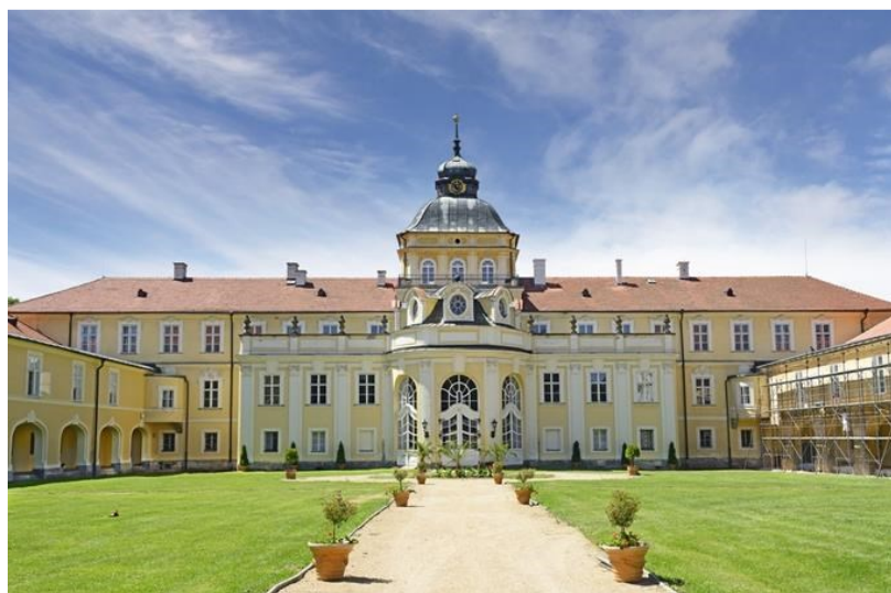
Obr. 33 - zámek