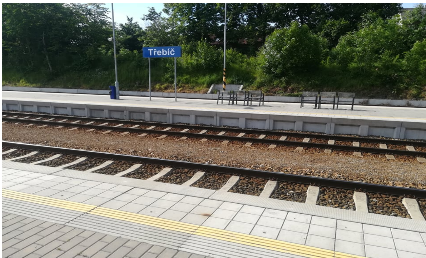
Obr. 16 – Opravený podchod na vlakovém nádraží v Třebíči