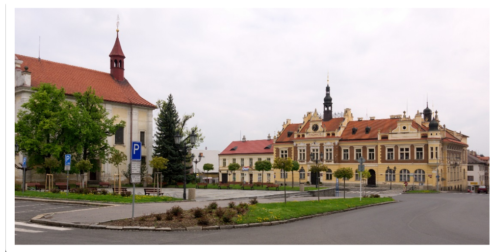
Obr. 32 - náměstí

Město Hořovice se nachází ve Středočeském kraji, v okrese Beroun, přibližně mezi Prahou a Plzní. Je obklopeno převážně přírodou. Nachází se tam několik historických památek. Žije zde 6790 obyvatel.