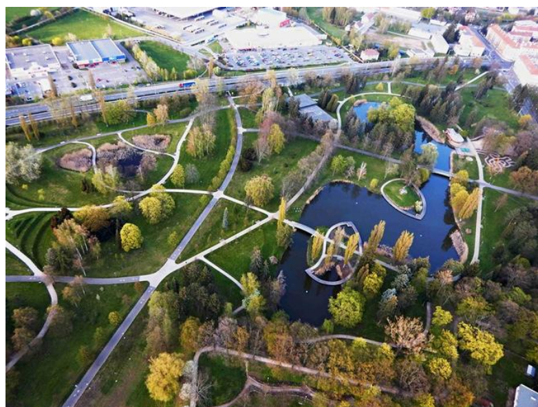
Obr. 36 - Šimkovy sady

Odpověď u muže, 25 let: „Tak třeba ty Šimkáče (Šimkovy sady, Hradec Králové) šly opravdu nahoru. Když jsem tam chodil jako dítě, tak tam spousta věcí nebylo. Je to místo, které na mě působí nejlíp z celého Hradce a starají se o to fakt dobře. Jen ty grily by se daly častěji a pravidelně čistit nebo opravovat. Když porovnám Šimkáče a Jiráskáče (Jiráskovy sady, Hradec Králové), tak Jiráskáče jsou hrozně zarostlý. Téměř tam nevysvitne sluníčko a to mi na nich hrozně vadí, že jsou takový temný. Naopak Šimkáče jsou otevřené a vzdušný a to se mi líbí.“ se shodovala s odpovědí ženy, 22 let: Ale Šimkovy sady jsou fakt super. Je tam mnoho využití a pořád se o to starají. Zase naopak Jiráskovy sady dost chátrají a lidé tam zas tolik nechodí, přijde mi, že se to tam nikam neposouvá.“ Informanti si jinak vývoj veřejného prostranství v Hradci Králové pochvalovali. Zazněla i výtku na Velké náměstí například od muže, 25 let: „Jinak mi přijde, že jak v Hradci opravili náměstí a dalo tam asfalt, tak to mi teda přijde, že to vypadá hrozně. Taky mi vadí, že je to vyřešený jako parkoviště a vůbec nezachovali historické jádro.“ Úřednice to ovšem okomentovala tak, že to není věc financí, ale stojí to na sporu s majiteli nemovitostí.