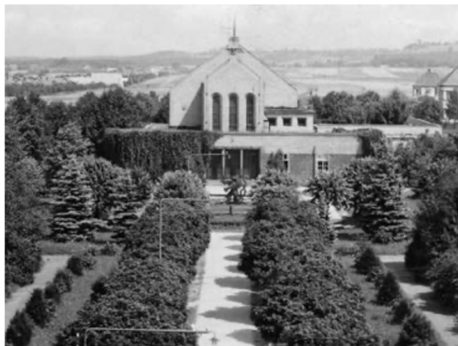
Obr. 3 a 4 - Sokolský park v Holicích před (vlevo) a po revitalizaci (vpravo).

Pokusy o proměny míst v okolí informantů byly třemi z nich hodnoceny kladně , přičemž byly vyzdvihovány snahy o provzdušnění, revitalizaci či definování prostorů a zároveň jejich nově nabytá multifunkčnost. Na druhou stranu informantka středního věku hovořila také o věcech, které podle ní daným místům škodí . „ Co pozoruju, tak těm místům většinou ubližuje to, že se nesnaží přizpůsobovat potřebám lidí, lidi by měli být vždycky na prvním místě před auty, kterým tady pořád budují parkoviště, nelíbí se mi, že se kvůli vymoženostem a dopravě staví na druhou kolej přirozené aktivity člověka, ale je určitě spousta míst, kde na tohle myslí. “ Mladý informant zase hodnotil negativně revitalizaci Sokolského parku v Holicích, jež hodnotí následovně. „ Těm místům ubližuje, když se totálně změní jejich koncept, a to místo pak úplně ztratí svého ducha. Třeba v Holicích, jak teď v rámci revitalizace parku vykáceli všechny stromy a vysázeli tam jenom nějaký metrový proutky, není tam útulno, a to místo pro mě ztratilo kouzlo. “ Informantem negativně vnímaná proměna je zachycena na následující fotografii.