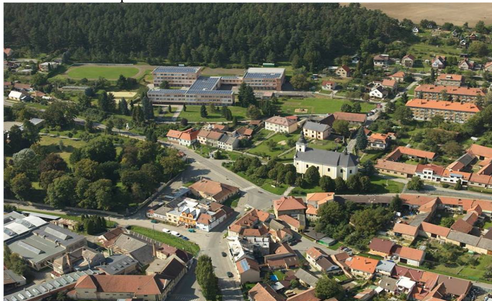
Obr. 17 – Velké Opatovice

Velké Opatovice se nachází v okrese Blansko v Jihomoravském kraji, 14km severně od města Boskovic. Žije zde přibližně 3800 obyvatel.