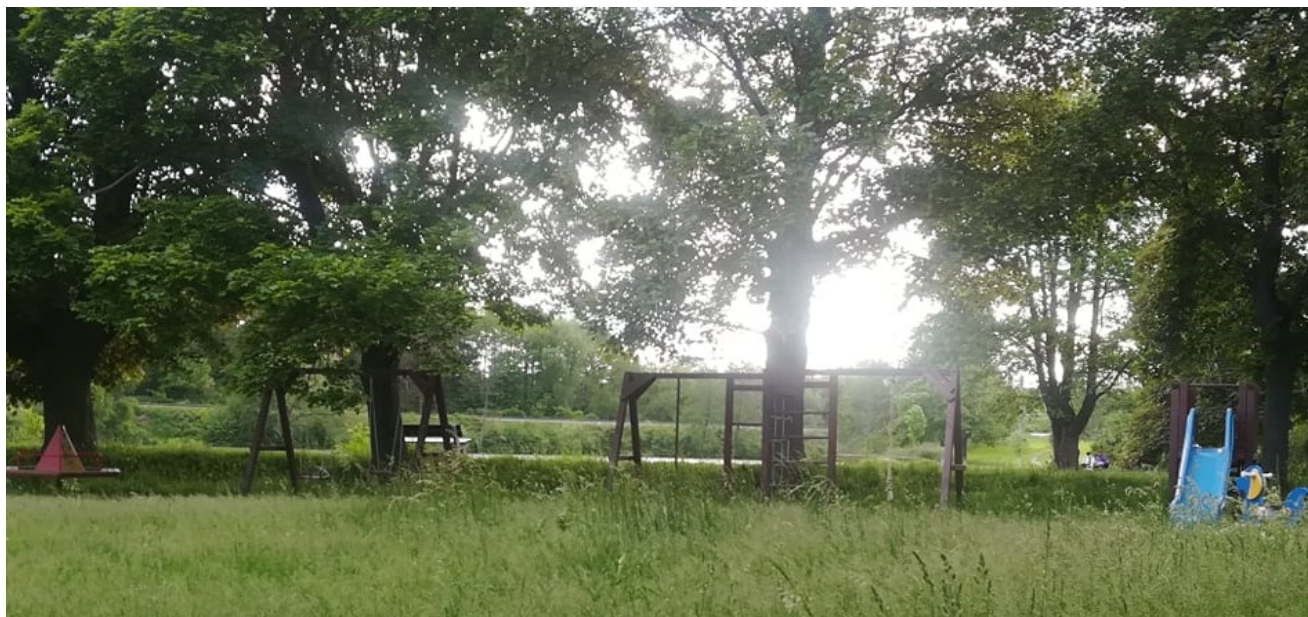
Obr. 14 – Požární nádrž 12 vedle Památníku osvobození v Okříškách