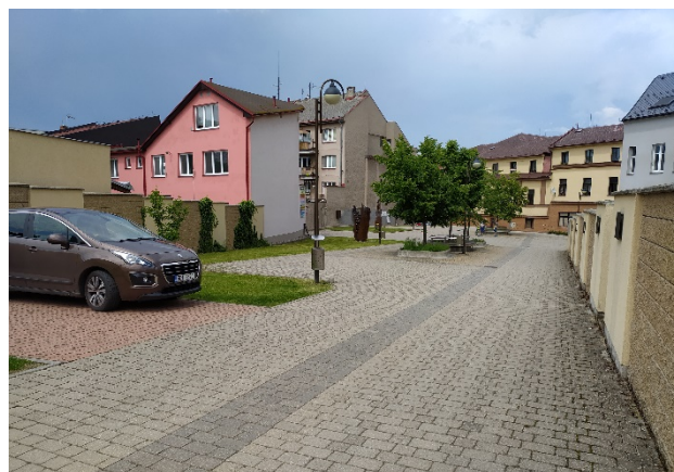
Obr. 28 - 31 Žamberecké náměstí